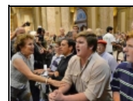
Macri: los lefebvristas "quieren marcar identidad"