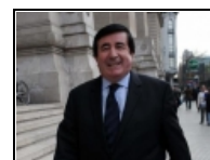
Sobreviviente de Auschwitz a Durán Barba: "Que venga a hablar conmigo"