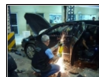
Secuestran 47 kilos de cocaína en auto de alta gama